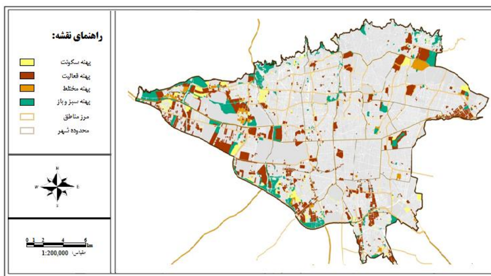
شکل ۳. پهنه‌بندی اراضی ذخیره توسعه و نوسازی شهری به تفکیک مناطق کلانشهر تهران (هکتار)