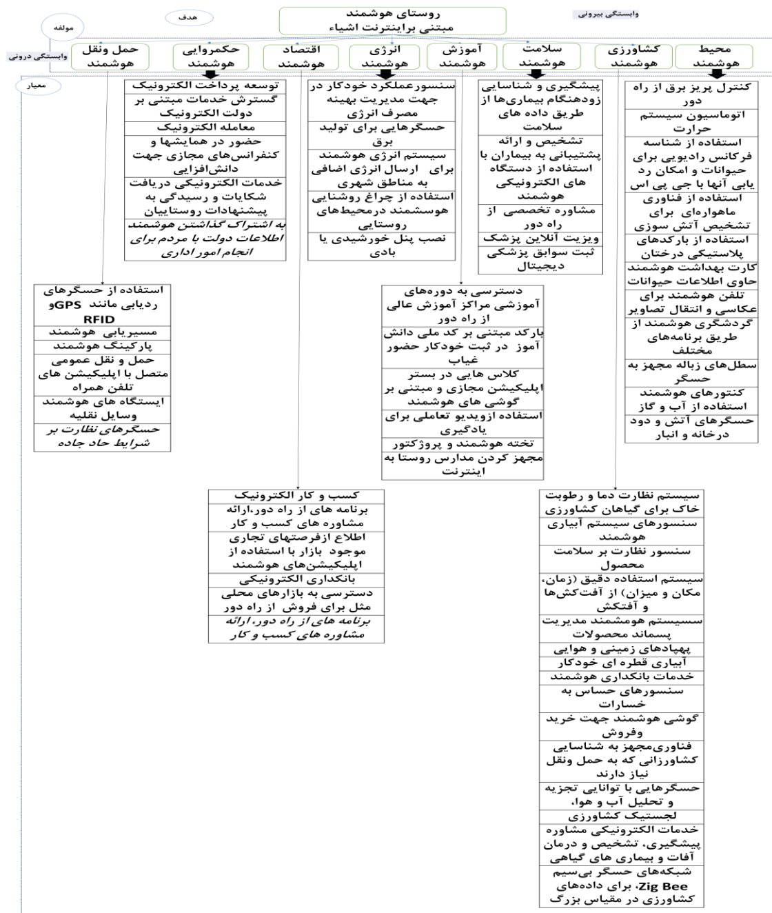
شکل ۳. مدل شبکه‌ای مؤلفه‌های شکل‌دهنده روستای هوشمند مبتنی بر اینترنت اشیا

W21: ابتدا معیارهای اصلی براساس هدف به صورت زوجی مقایسه می‌شود. W22: معیارهای اصلی براساس هر معیار به صورت زوجی مقایسه می‌شود.