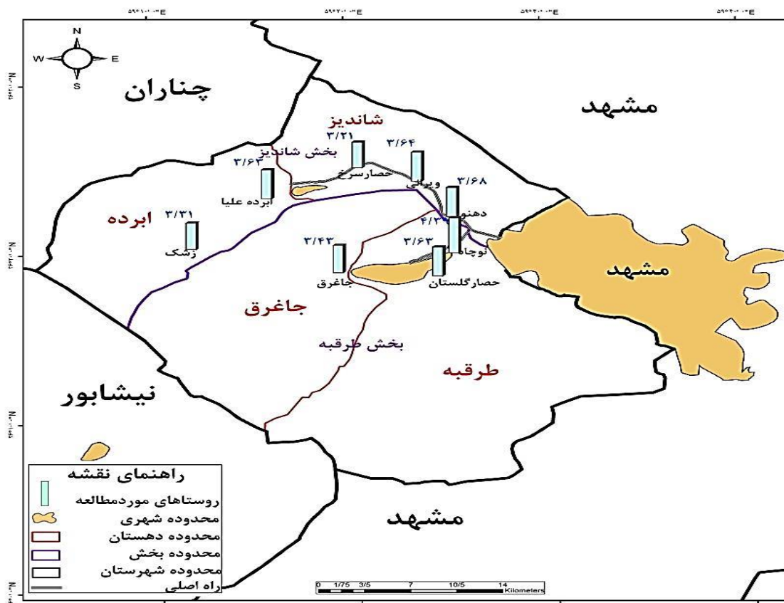
شکل ۳. نمایش فضایی وضعیت نهایی سازگاری در روستاهای مورد مطالعه