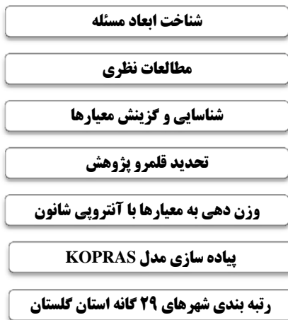
شکل ۱. چارچوب فرآیندی تحقیق

گلتسیس و کلتوس ۲ (۲۰۱۱) در مقاله «سنجش میزان توسعه و نابرابری منطقه‌ای در مناطق پیرامونی یونان با استفاده از تکنیک تحلیل عاملی و خوشه‌ای»، مناطق یونان را به لحاظ شاخص‌های اقتصادی و اجتماعی بررسی کرده و به این نتیجه رسیدند که دوره زمانی ۲۰۰۷-۱۹۹۵ بین مناطق یونان همگرایی وجود ندارد و شاخص‌های توسعه در بین مناطق به صورت عادلانه توزیع نشده است.